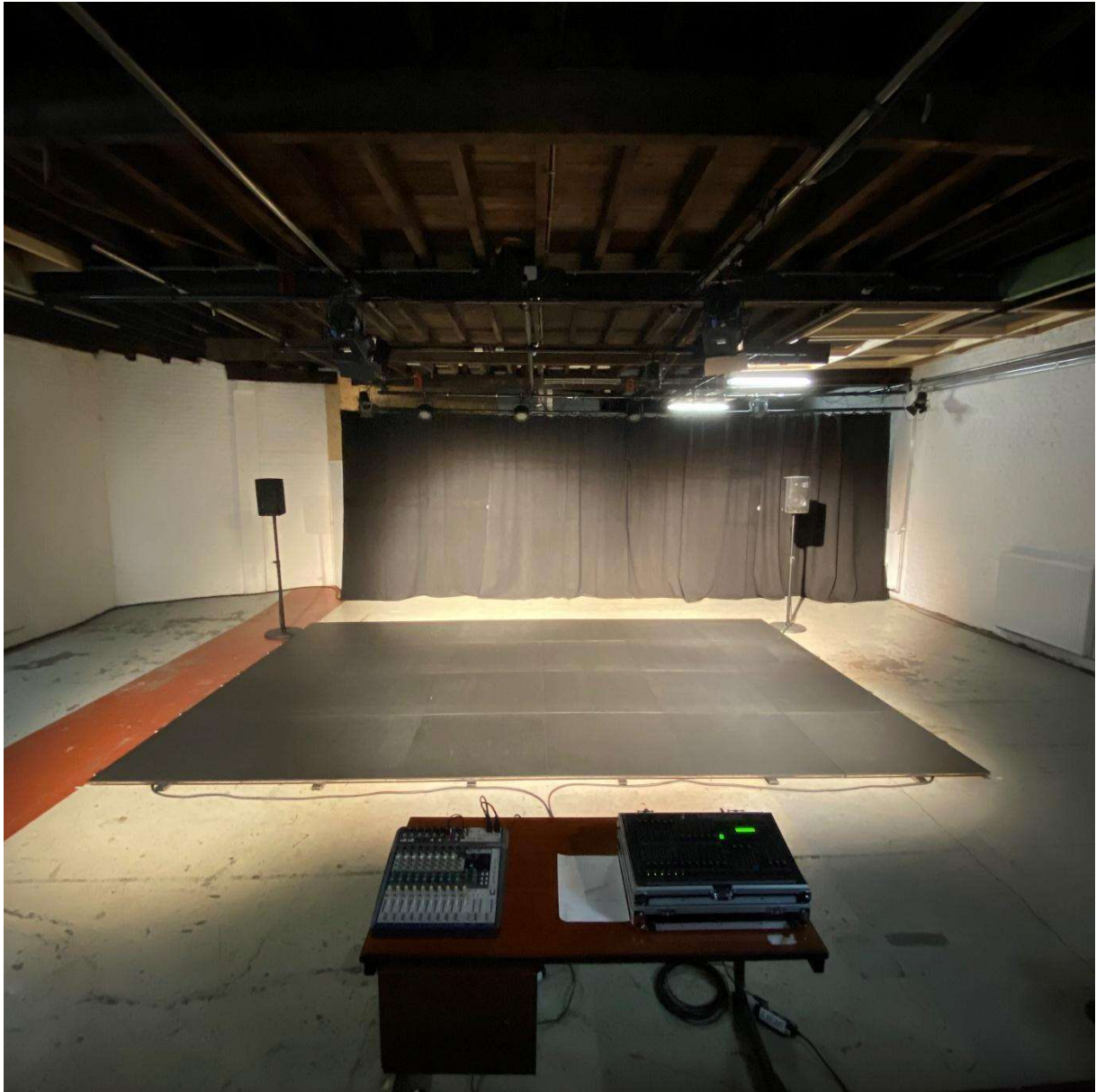
Vue du plateau avec le plancher installé, le gradin est dans notre dos.